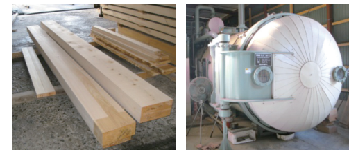
低温乾燥のヒノキ梁桁材 高周波真空乾燥装置